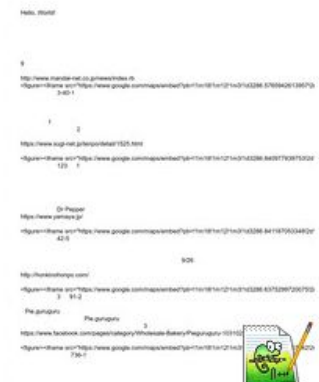
📁 香芝の新しいお店情報など.txt